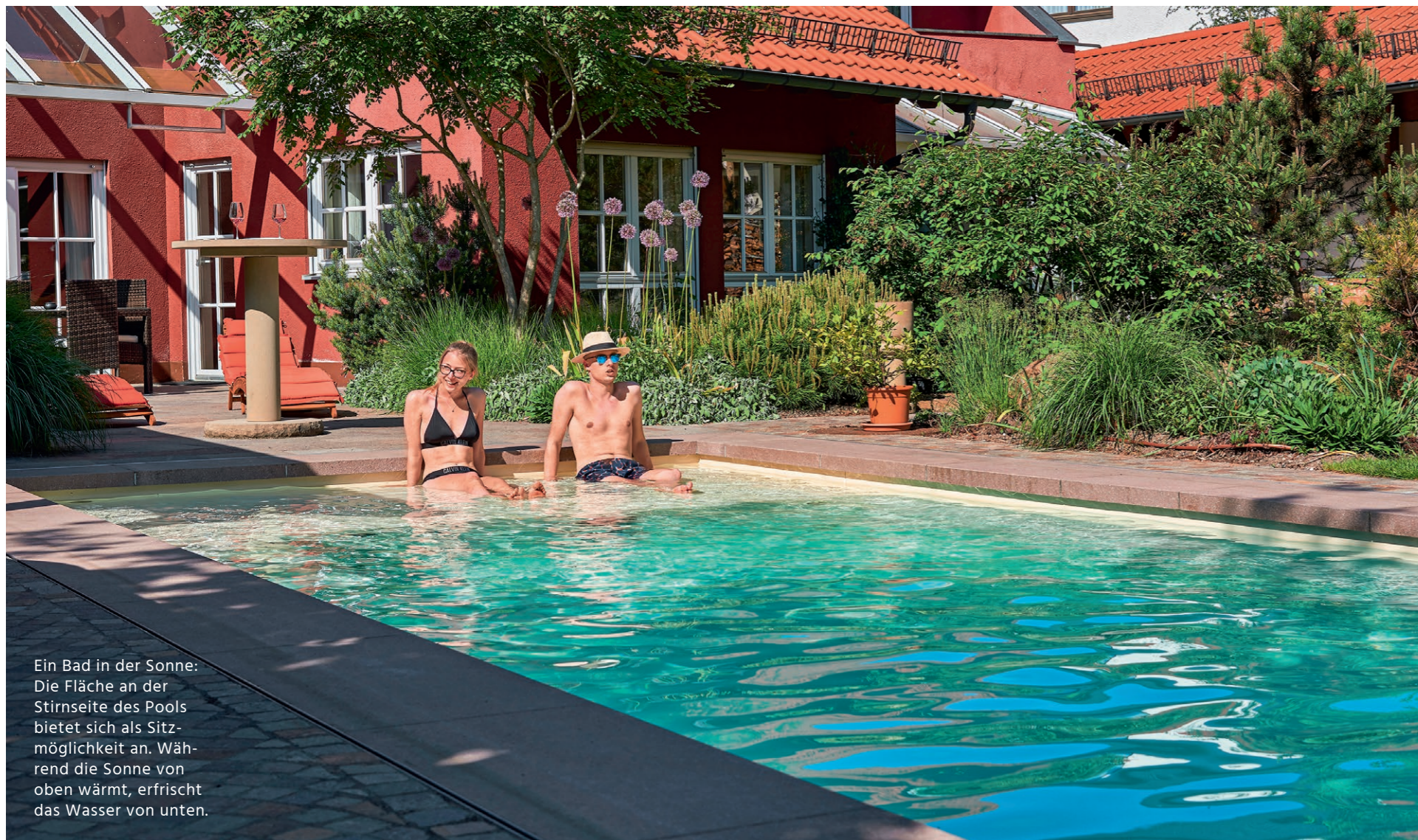
Ein Bad in der Sonne: Die Fläche an der Stirnseite des Pools bietet sich als Sitzmöglichkeit an. Während die Sonne von oben wärmt, erfrischt das Wasser von unten.