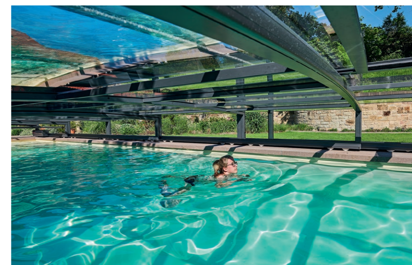
Die Höhe der Poolüberdachung ist nicht nur so gewählt, dass ein komfortabler Einstieg, sondern auch das Unterschwimmen gewährleistet ist.

MIT DIESER POOLANLAGE ist ein paradiesisches Zuhause und ein neuer Lebensmittelpunkt für Familie und Freunde entstanden – ein Premiumbad der Extraklasse. In der Gestaltung sind viele Details zu erkennen, die zu einem harmonischen Ganzen werden. Es wurden verschiedene Aufenthaltsorte geschaffen, die für sich einzeln und in Verbindung mit den anderen Elementen funktionieren. Es gibt einen überdachten Terrassenbereich sowie eine freie Sitzlounge im Anschluss an den Pool. Der Pool selbst bietet ebenfalls eine Sitzfläche und ist nicht nur zum Entspannen, sondern auch sportlich nutzbar. Der daneben befindliche Whirlpool ermöglicht eine wohltuende Massage nach einem langen Tag.