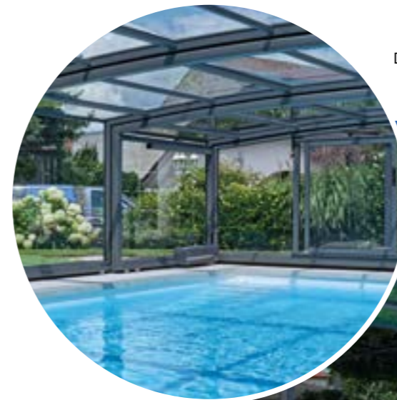
Die Dachfläche besteht aus gebogenem, hagelsicheren Sicherheitsglas – für freien Blick und für ein schnelles Erwärmen des Raumes. Seitentüren bieten bequemen Zugang.