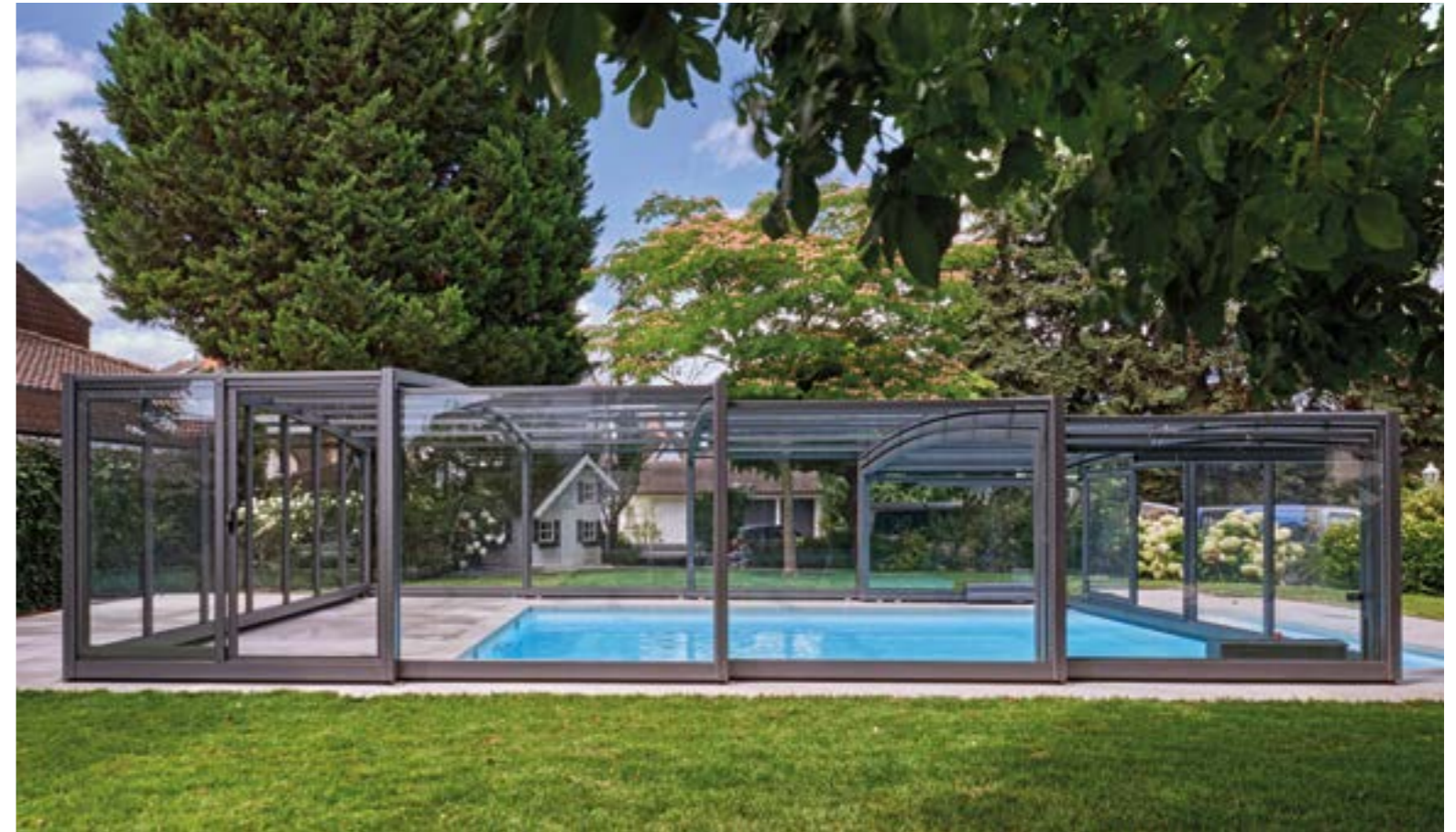
Dank der patentierten Technik lassen sich die Elemente teleskopisch ineinander führen. Die Abdichtung gegen Schmutz am Boden übernehmen UV-beständige Gummilippen.