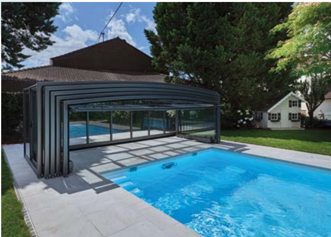
Fürs Open-Air-Baden lässt sich die ganze Überdachung inklusive der eingeschwenkten vorderen Giebelwand nach hinten weiterfahren.