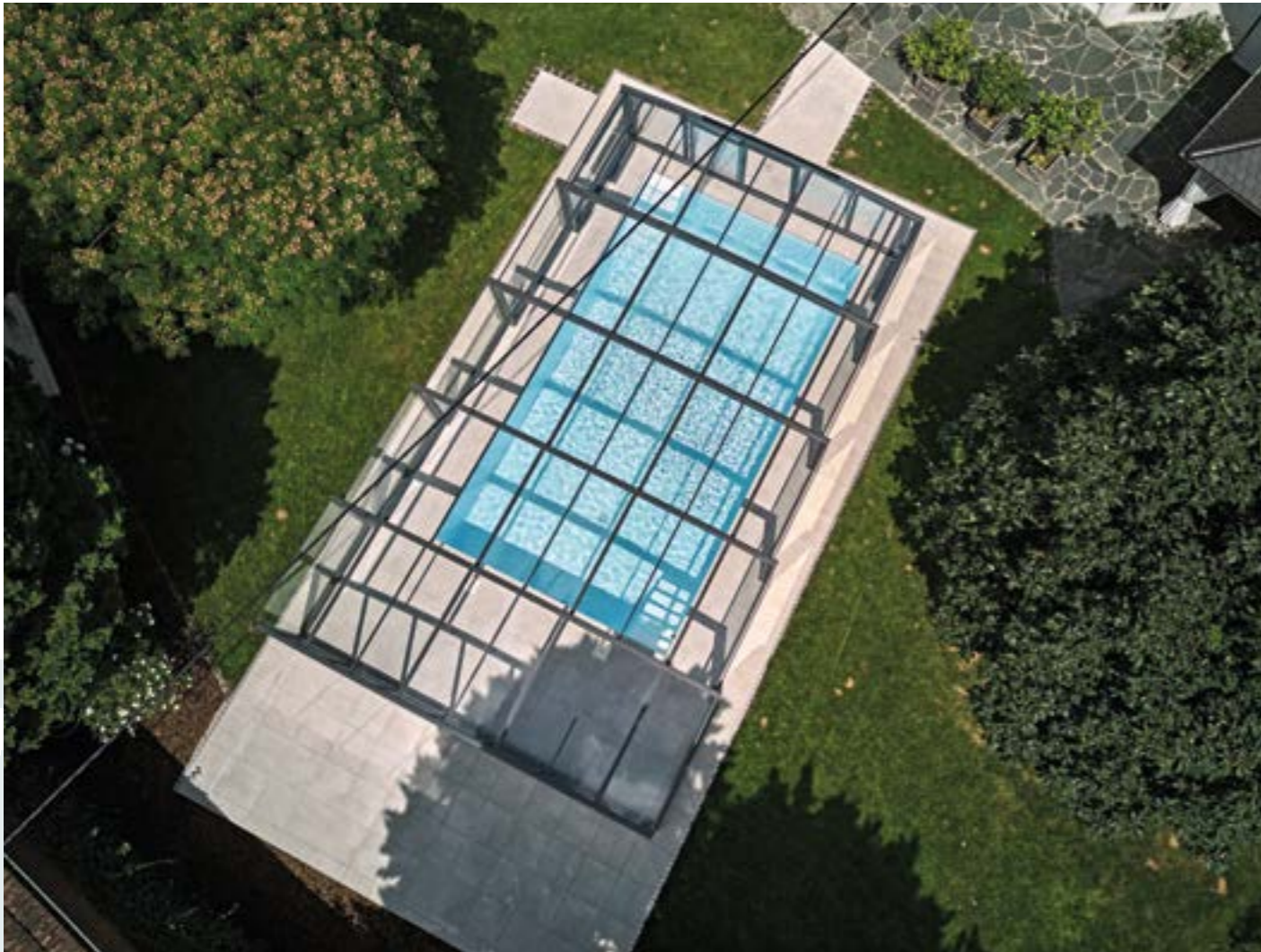
Grafisch reizvoll: Aus der Vogelperspektive wird besonders gut ersichtlich, warum „Rimini“ als die filigrane hohe Schwimmbadüberdachung im Programm des Herstellers geführt wird. Innen ist Platz genug für einen Tisch und Liegestühle.