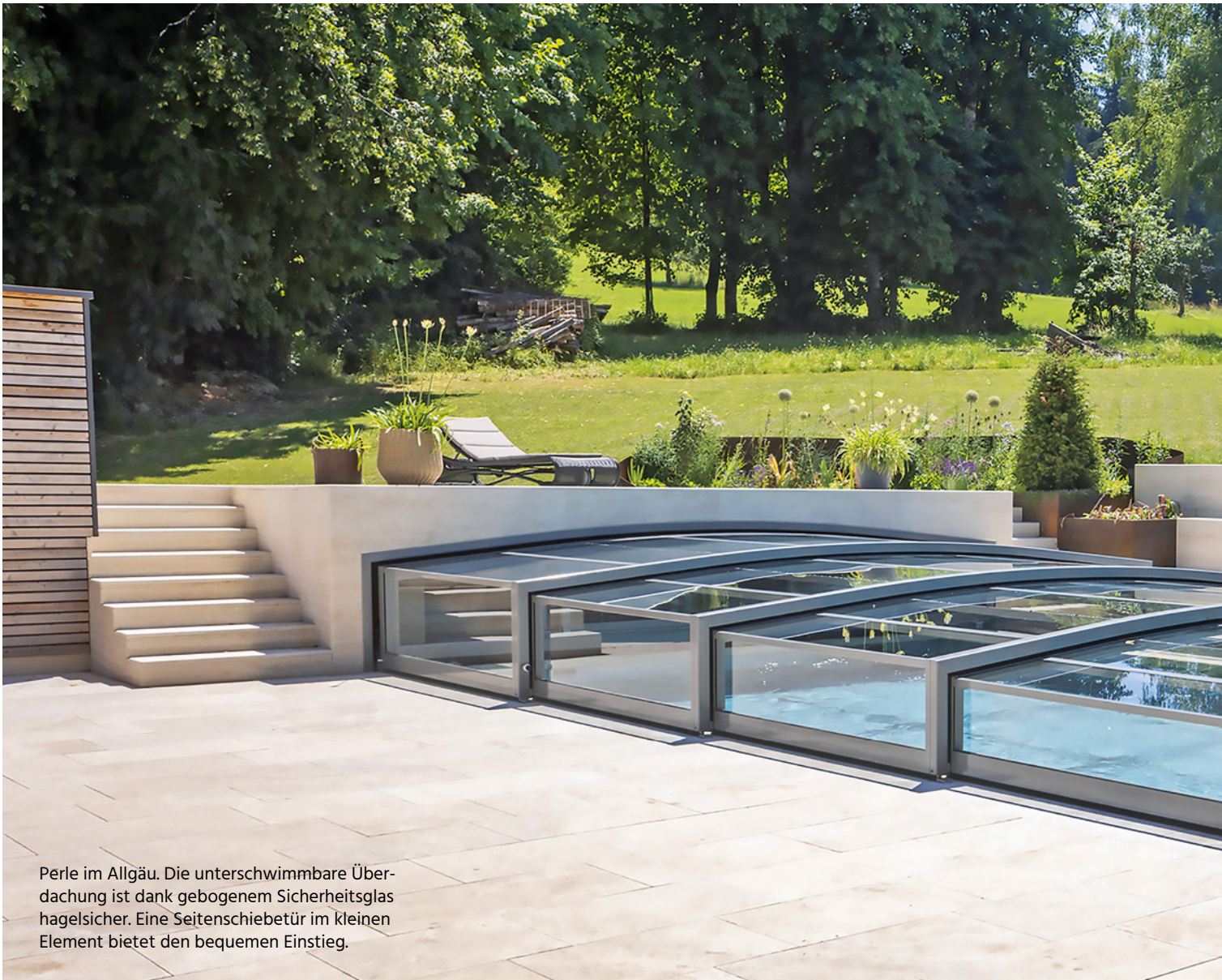
Perle im Allgäu. Die unterschwimbare Überdachung ist dank gebogenem Sicherheitsglas hagelsicher. Eine Seitenschiebetür im kleinen Element bietet den bequemen Einstieg.

Die beruflich stark eingespannten Bauherren schufen sich ein Wellnessparadies im eigenen Garten. Besonderes Feature: die gleichermaßen praktische wie qualitativ und ästhetisch hochwertige Poolüberdachung.