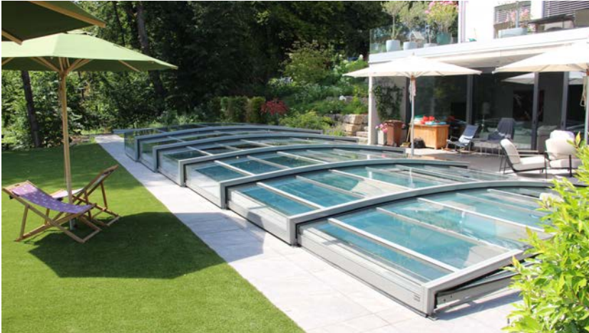
Die Flachüberdachung erlaubt den freien Blick von der Sitzgruppe in die Landschaft.