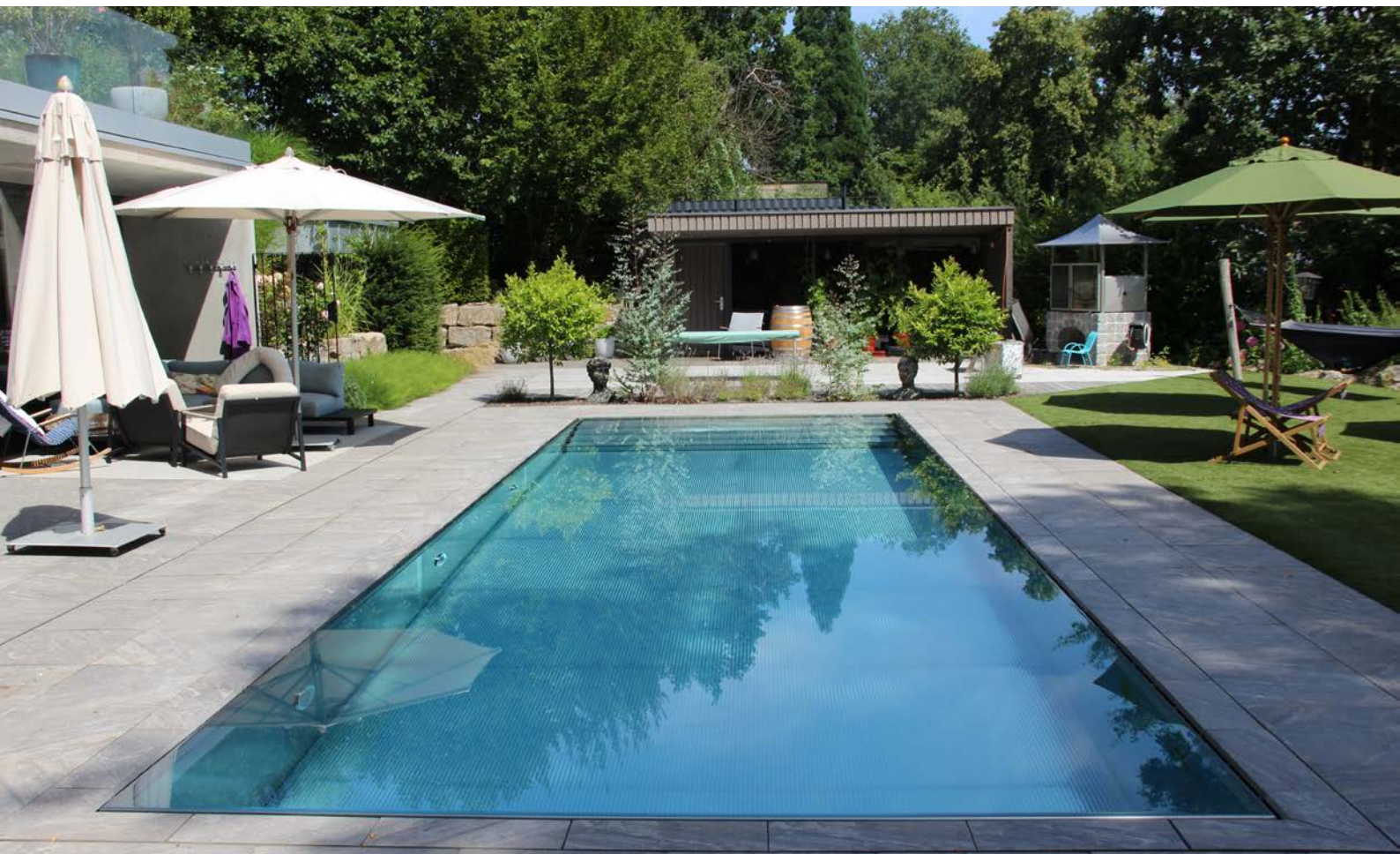
Oben: Der Edelstahlpool passt vom Design her in den Garten und ist hochwertig ausgestattet. Unten: Ein immerhin 7 m langes Parkdeck steht hinter dem Pool zur Verfügung.