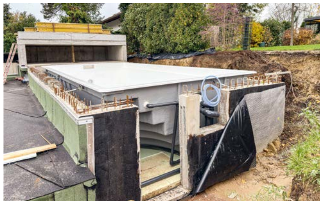
Der Einbau des Pools ging routiniert vonstatten. Das Becken wurde auf die Betonplatte gesetzt und an die Technik angeschlossen.

Ein besonderer Clou ist die schienenlose Konstruktion. Wie bei Paradiso üblich, kommt die Überdachung ohne Bodenschienen aus. Dennoch laufen die Elemente spurtreu und präzise in jede gewünschte Position und sind bequem bedienbar. Das bedeutet keine Stolperfallen im Poolbereich und uneingeschränkt nutzbare Terrassenflächen ohne optische Beeinträchtigung. Optional können alle Überdachungen mit solarbetriebenen und synchronisierten Fahrantrieben ausgestattet werden, die von Paradiso selbst entwickelt und produziert werden.